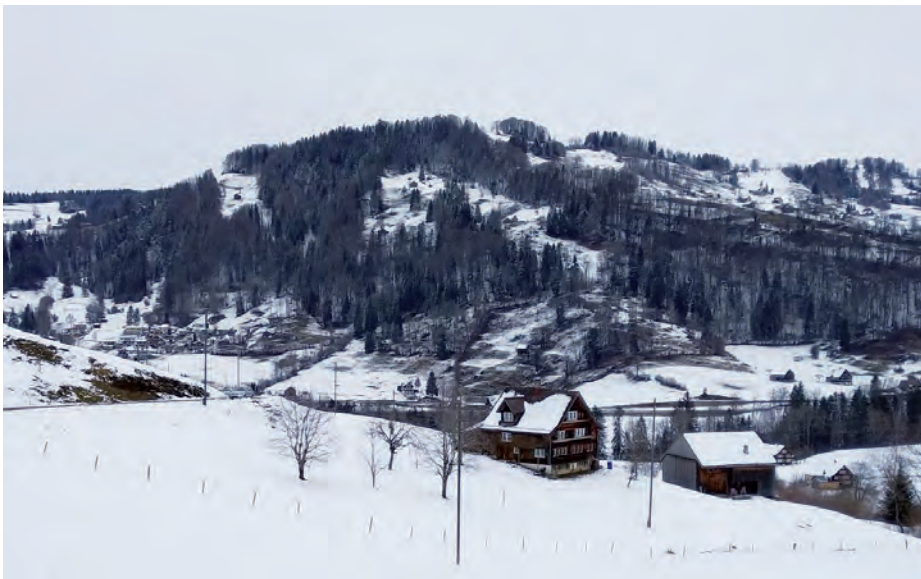
Schutzobjekt in einer Streusiedlung

Aus diesem Grund starten wir im Juni 2021 mit einer Regionalgruppe, welche sich den Anliegen annimmt und Ansprechpartner für Gemeinden und Privatpersonen ist. Das Gebiet wird sich auf das Obertoggenburg und auf die Region See & Gaster begrenzen. Aus der Region See & Gaster suchen wir noch interessierte Leute, welche in unserer Regionalgruppe mitarbeiten möchten. Nebst der Bauberatung befassen wir uns mit Themen, welche im Zusammenhang mit den Ortsbildern und der Landschaft stehen.