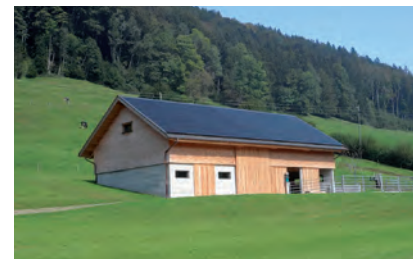
Neubau Scheune, gebaut 2020

Im letzten Jahr konnte ich etliche Bauvorhaben in der Landwirtschaftszone beraten. Immer wieder werden alte Bauernhäuser durch Neubauten ersetzt. Hier gilt für mich der Grundsatz: Wenn das Alte aus überzeugenden Gründen nicht erhalten werden kann, muss das Neue mindestens so gut sein wie das ursprüngliche Haus. In diesem Sinne werde ich weiter beraten.