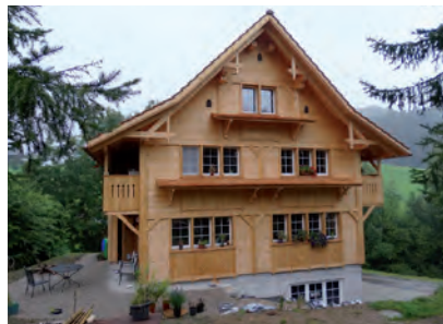
...und das fertige Toggenburgerhaus im traditionellen Stil

traditionellen Gebäude, die entstehen, wenn traditionelle Bauweisen nicht transformiert werden. Frau Tobler, die Besitzerin, hat mir Fotos geschickt. Sie hat grosse Freude an ihrem neuen Toggenburger Haus, wofür sie viele Komplimente erhält – sogar aus Zug sind Leute angereist, um das neue Haus zu bewundern.