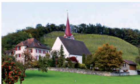
Der geplante Antennenmast käme zwischen Kirche und Weinberg zu stehen

bilder der Schweiz (ISOS) ist Eichberg-Dorf mit dem Schutzziel A eingestuft. Insbesondere wird die Silhouette von Eichberg mit ihren «zwei Polen» erwähnt, nämlich «am Hügelfuss die emporragende ref. Pfarrkirche, vorgeschoben auf der Wiesterrasse das dreigeschossige Schulhaus, beide mit weitreichender Wirkung.» Fast genau in der Verlängerungsachse dieser zwei prägenden Vertikalelemente