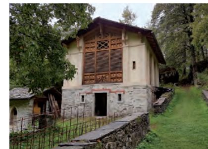
Historischer, schöner Stall im Bergell bei Bondo

Tag und Nacht verlassen, um auf die Weide zu gehen – nach Lust und Laune und rund um die Uhr – im «freien Ausgang». Ich stellte mir bei der Beratung die Frage: Darf auch eine Scheune schön sein? Die Antwort bekam ich auf einer Reise ins Bergell. Oberhalb von Bondo habe ich diesen sehr schönen Stall entdeckt (siehe Foto rechts). Die Einheimischen von Eggersriet, die den neuen Stall auch neckisch «Villa Kuh» nennen, drücken damit ihre Wertschätzung für dieses Kleinod aus.