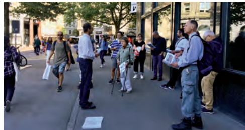
Baumboulevard am historischen Stadtgraben

Auf verschiedenen Ebenen standen im vergangenen Jahr weitere Aspekte des öffentlichen Raumes im Vordergrund. So organisierte die Stadtgruppe im Rahmen des Kulturlandschaften-Jahres 2020 sechs Führungen zu sehr unterschiedlichen Orten, von denen aber nur drei durchgeführt werden konnten. Diese Führungen sollen auf die wertvollen Freiräume hinweisen, aber