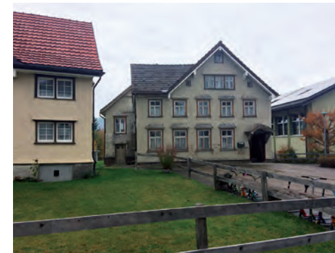
Das ehemalige Schwesternhaus – dem Abbruch geweiht

Trotz der Corona-Pandemie ist in Innerrhoden 2020 ungebremst weitergebaut worden. Der Heimatschutz St. Gallen / Appenzell-Innerrhoden hat in einem Fall eine Stellungnahme abgegeben, Einsprachen wurden keine eingereicht.