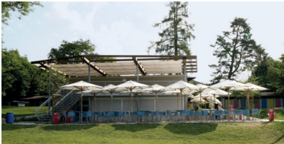
Badi Rotmonten mit neuer Terrasse, Holzdeck und Sonnensegeln

Die Stadtgruppe, Vertreter der städtischen Denkmalpflege und des Hochbauamtes hatten im Frühsommer die Gelegenheit, von Georg Streule vom Büro GSI Architekten und Projektleiter der frisch renovierten Badi Rotmonten, noch vor der offiziellen Wiedereröffnung durch die frisch sanierte Anlage geführt zu werden, mit anschliessendem Apéro auf der neuen Terrasse mit Holzdeck und Sonnensegeln.