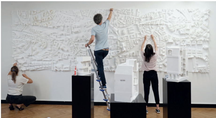
Stadtbild