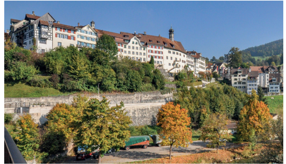
Die gut erhaltene «Mini.Stadt» im Toggenburg, über den Rebbergen hinunter zur Thur