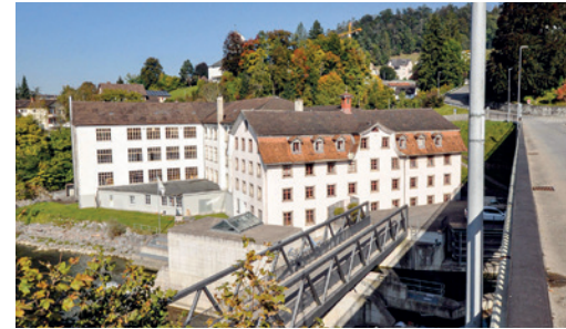
Fabrik Stadtbrücke (ehemals Fein Elast Areal)

Es gelingt Lichtensteig neue Menschen anzuziehen und Eingewessene zu halten, Kultur zu