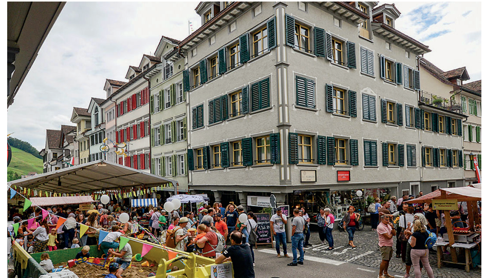
Die feiernde Bevölkerung am Wacker-Fest in den Gassen von Lichtensteig