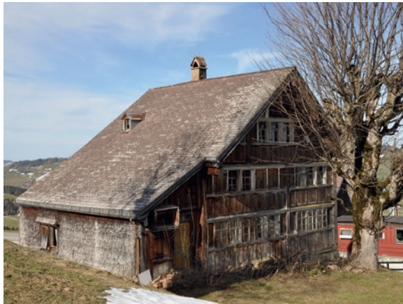
Unterer Horst, Appenzell

Instandstellung. Diese Elemente wurden darin befürwortet. Die Baukommission inneres Land lehnte das Abbruch-/Baugesuch in Anwendung kantonalen Rechtes ab. Ein dagegen erhobener Rekurs der Bauherrschaft wurde durch die Standeskommission (Regierung) gutgeheissen und die Baukommission angewiesen, das Baugesuch nach den zonenkonformen Vorschriften des eidgenössischen Raumplanungsrechts zu beurteilen. Die Einsprache des Heimatschutzes SG/Al bleibt somit hängig.