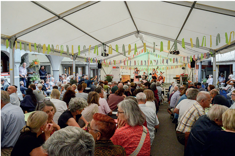
Festzelt am «Wacker-Wochenende» mit Toggenburger Meitli Musig